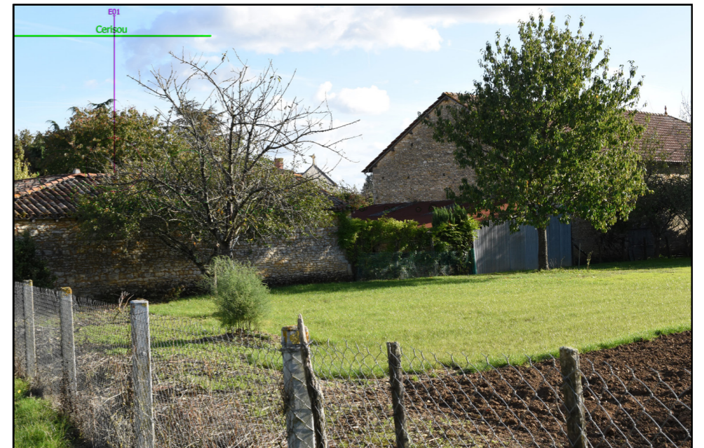
4 - PHOTOSIMULATION - ( Éolienne en service Éolienne accordée Projet éolien de Champniers ) - Vue Panoramique 3x40°