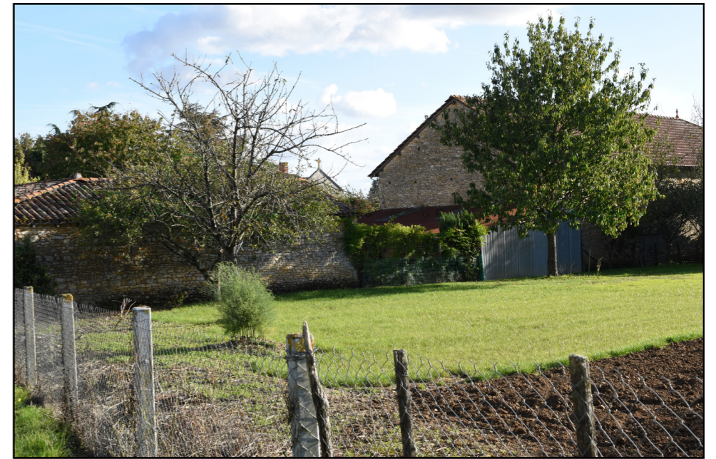
3 - SITUATION EXISTANTE - ( Éolienne en service Éolienne accordée ) - Vue Panoramique 3x40°